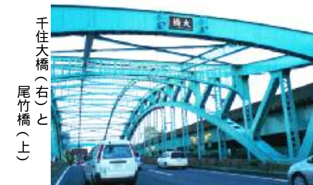
千住大橋(右)と 尾竹橋(上)