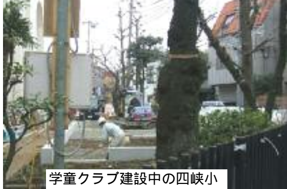
学童クラブ建設中の四峡小

町屋には、現在四つの学童クラブがあります。町屋学童クラブは、ふれあい館建設のために四峡小学童クラブとして移設、体育館道路側に現在建設中。どこも