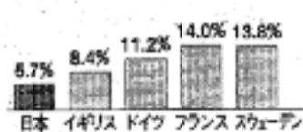
図③ 社会保障財源に占める事業主の負担割合

※社会保障財源(非GDP比)の国際比較、「社会保障の在り方に関する懇談会」への報告書(国保)資料から