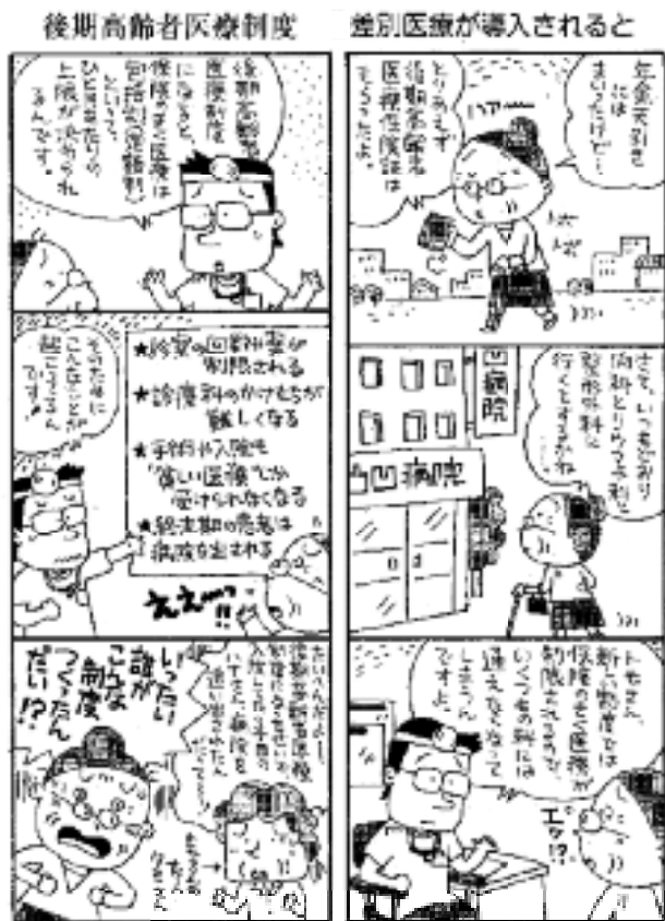
※医療制度の内容は現在政府が検討している内容にもとづく手続です。