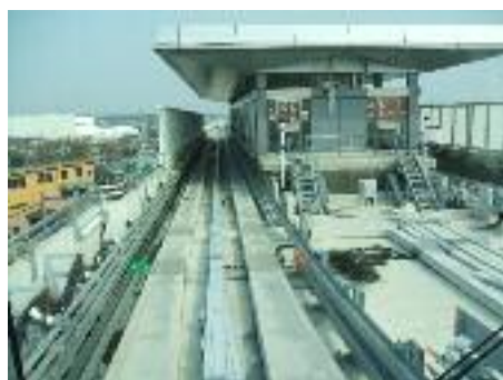
終点見沼代親水公園駅(上) 熊野前駅付近から町屋駅方面 をのぞむ(下)