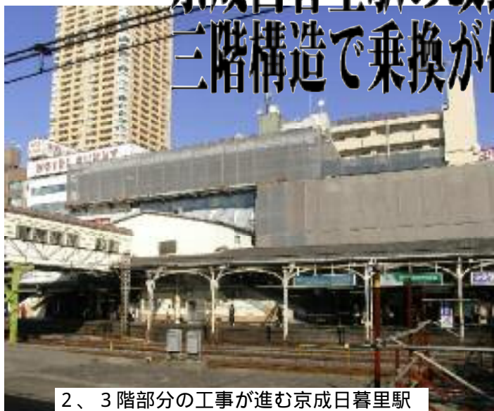
2、3階部分の工事が進む京成日暮里駅

京成日暮里駅の改良工事が長く続いています。工事によって大変不便な状態が続いています。この改良工事は、上下同じで大変狭いホームを上下線で1階と3階に分け(2階はコンコース)スカイライナー専用ホームも設けます。もちろんエレベーターも設置。いままでよりかなり使いやすくなるようです。 この改良工事は、日暮里から成田まで36分で結ぶ成田新高速鉄道線が再来年に開通することにあわせたものでもあります。 荒川区の関心事は、これによって京成日暮里駅で多くの旅行者が「荒川区を訪れてくれるかどうか」にあるようです。もとより「千客万来」は、大事な視点です。問題は、来ていただける魅力的