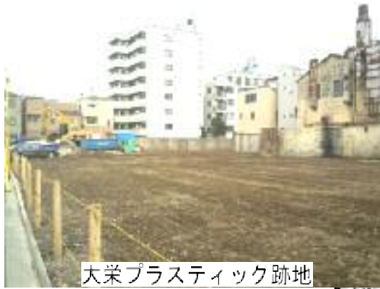
大栄プラスチック跡地

ホクヨープライウッド株式会社 (町屋7丁目18番) 特別養護老人ホーム3,000㎡と 公園7,000㎡用地 合計10,400㎡ 22億5900万円