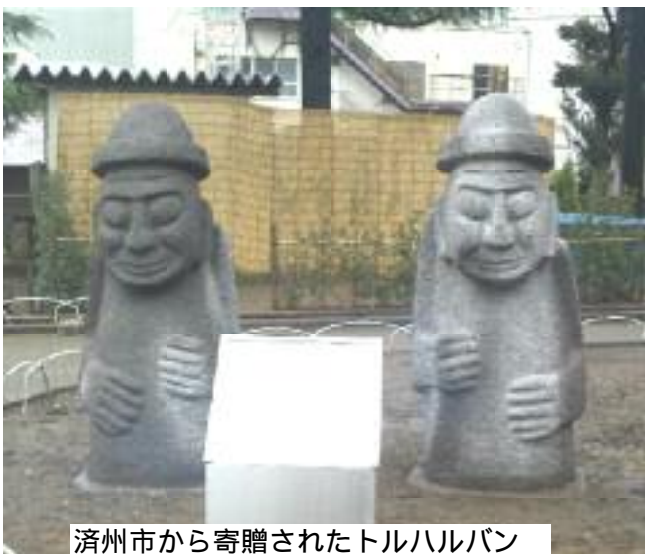
済州市から寄贈されたトルハルバン

一月三十一日、交流都市韓国済 州市から贈られた「トルハルバン」 (石のおじいさん 文官と武官を 表す)の除幕式が行われ私も出席 しました。この二体の像は、約二 分の高さで済州島を代表する 民俗石像です。ご存じのよう に荒川区には、韓国、朝鮮籍 の区民が多く暮らしています。 帰化された方もいますので、 出身者だともっと多いはずで す。その約八割は、済州島出 身といわれます。その歴史を たどる紙幅はありませんが、 今回のトルハルバンを見て故 郷に思いを寄せる年配の方も 多いはず。故郷を離れ、 日本に渡ることになった背景 には、「貧困」や日本の植民 地支配、戦後の朝鮮戦争など