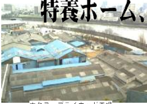
ホクヨープライウッド工場

荒川区は、新年度予算含めて区内四カ所で大規模な土地取得を行うことを四日の総務企画委員会で明らかにしました。取得予定面積は、1.8ヘクタール、総額約54億円を超えます(いずれも下地図の太枠内、価格は現時点での予定)。いずれも工場の跡地です。不況の影響もあってか、従来のように「マンション開発業者」への売却ができない状況も考えられます。公共用地が一定規模で確保され生活密着型の施設などに活かされることは重要です。同時に、購入過程の透明性確保や、施設の必要性や設置場所など区民的な議論も並行して行うことが求められます。