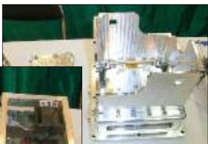
(上) 区内企業が協力した衛星を納める金属ケース