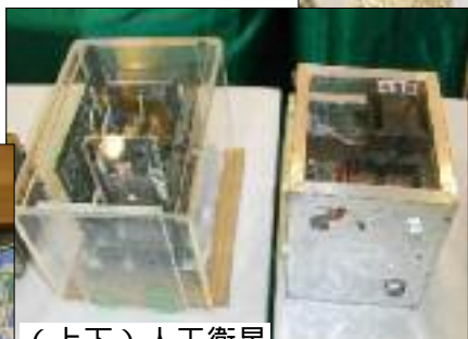
(上下) 人工衛星の模型