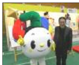
産業振興シンボルキャラクター「わざ丸」作者とともに

区内「ものづくり技術」の底力を活かすとき 区の専門職員など支援体制強化が急がれます 三月十四、十五日、南千住総合スポーツセンターで「荒川区産業展」が開かれました。 やはり注目は、昨年打ち上げられたH2ロケットです。 宇宙に運ばれた産技高専（旧航空高専）の人工衛星です。内部は、高専の学生が作り上げました。しかしそれを納める金属の箱などは千分の一ミリの精度が必要。 それを区内の金型製造業者など町工場の技術が生かされました。まさに「町工場」の力、底力が発揮されました。ここに荒川区の産業の未来もあると感じました。