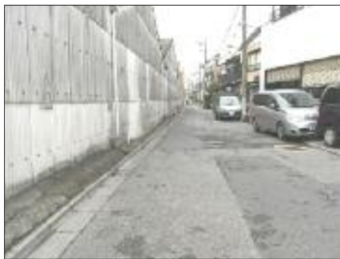
かつての清掃車の進入路

公園、特養ホームを中心にした整備は住民合意で 三月三十一日、長く不燃ゴミの船積み場として使われてきた「尾竹橋ゴミ中継所」の閉所式が行われました。結果、これまでゴミ収集車がひっきりなしに走行していた道路は、かなり静かになるなど周辺環境も大きく変化するはずですが、同時に、この中継所の敷地は、かなりの広さ（左地図参照）があります。二〇二〇年まで「清掃施設」で使うことが義務づけられているそうです。