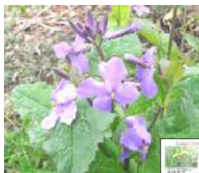
上は、ハナダイコン...か？下は、姫踊子草かな？

尾久の原公園と言えばウォーキングやいまで言えばしだれ桜の下で花見、自然が再生した空間に多くの人が集まります。ところで公園に入り管理事務所の柵に尾久の原公園で見られる四季折々の野草の写真が掲示されています。あまり草花に詳しくない私ですが、掲示を頼りに少し散策してみました。掲示は四月の野草でこれからのようでも少し見つけることができました。写真を撮りましたが果たしてその野草名が合っているかどうか？野草を探しに出かけてみてはいかがですか。 横山幸次