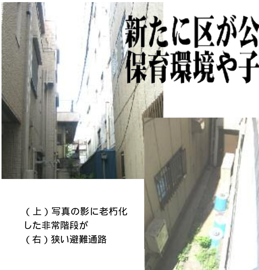
(上) 写真の影に老朽化した非常階段が (右) 狭い避難通路

規制緩和で安全性と保育内容も基準を緩め、民間任せにする流れを変えて、区が責任をもつべき時ではないでしょうか。