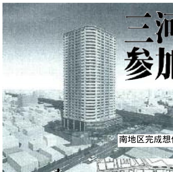
南地区完成想像図