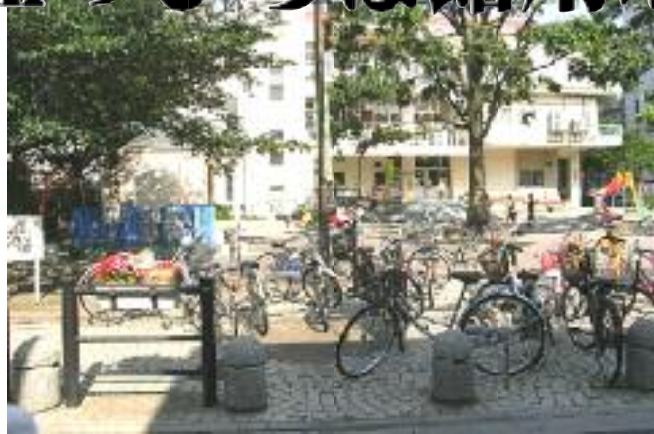
平日でも学校が終われば子どもたちでいっぱい

区は、五月二十日の区議会総務区民委員会に、購入予定の「町屋一丁目用地」（左地図参照）活用策を報告。ここに（仮称）「町屋ふれあい館」を建設、合わせて「道路工事事務所」「公園管理事務所」を設置する計画です。また現在の町屋ひろば館については、建物の耐用年数もあり、立地特性をふまえ、現在の施設を生かした活用」を検討するとしています。 町屋ひろば館は、事実上「児童館」として多くの子どもたちや子育て世代のみならずにも利用されています。前が公園でもあり平日、休日問わず子どもたちでにぎわい「子どもたちの居場所」ともなっています。これまでと同じ規模のふれあい館で高齢者事業なども一緒につこととなります。 これまでと同じ「ふれあい館」の施設規模、内容でよいのか、子育て支援、子どもたちの居場所づくりの観点からも検討が必要です。