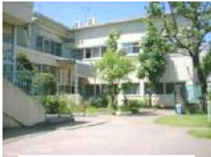
町屋保育園の来年度から

あらためて問われる「財政効率」給食は保育の重要な部分です 区は、二〇〇六年度から開始した保育園給食の民間委託を二〇一二年には公立保育園十五園全を民間委託する方針を明らかにしました。保護者アンケート・専門家の現地調査・園長栄養士保育士による合同評価を実施、いずれも高い評価を得たとしています。 財政効率は一園あたり二三〇万円と発表。これは、ベテラン職員と民間のパート職員の人件費比較であり、新規職員を採用すれば経