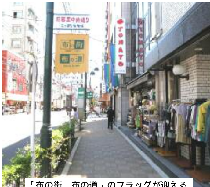
「布の街、布の道」のフラッグが迎える

先日、議会の総務企画委員会の日暮里繊維街を視察。午前中もあり人出はこれからと言うところでした。ここは、日本橋横山町と並ぶ繊維問屋街です。古くは、大正時代に浅草から移転してきたのが始まりとのこと。いまでは、テレビでも幾度も紹介され区内有数の商店街となつています。かつての間屋街から「卸、小売併用」型への転換に活性化の力があるようです。区内の各商店街の苦境は深刻さを増しています。商店街は、商いの場であるとともに、地域の