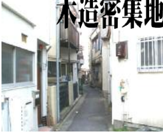
こうした路地が至る所に