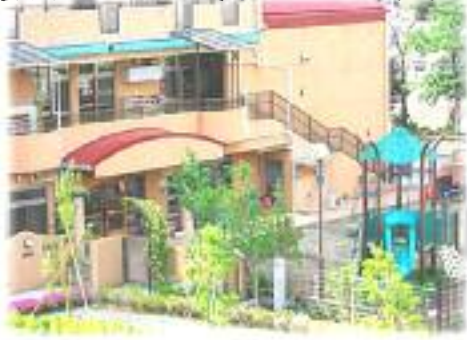
尾久隣保館保育園

「仕事・子育て両立」の願いに応えるために、すべての地域で保育園の計画的整備が急がれます。いま「待機児童」の解消、働く機会の保障が、政治の大きなテーマになっています。 働きたくても「保育園」がないために働けない、「産休明けで復職しようにも保育園がない」など深刻な実態が各地で報告されています。荒川区も決して例外ではありません。人口急増地域の南千住汐入地域は、もちろんですが、区内全域で同様の問題を抱えています。 以前区の子育て支援に