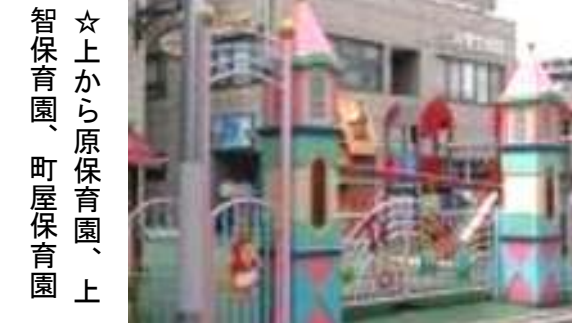
☆上から原保育園、上智保育園、町屋保育園

町屋地区の0歳児は区内最高倍率… 区内全域の認可保育園増設は緊急です 今年も保育園に入りたくても入れない「待機児童」が大きな問題になりそうです。昨年締め切られた時点での4月保育園申し込み状況は、全区平均で0才から2才で受入枠を上回っています。人口増の著しい南千住、日暮里地区に加えて町屋地区も深刻です。特に町屋地区の0歳児の受入状況は、受入枠を35%近く上回って全区最大となっています。この間の人口動態から見ても、町屋5、6丁目などでマン ション建設が進み、子育て世代が増加しています。いまま、比較的余裕のある地域でも保育園の空きがあれば働きたい、子ども手当より保育園増設を優先してとといった声も多くあります。今後の区の対応が問われます。