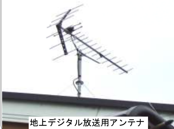
地上デジタル放送用アンテナ