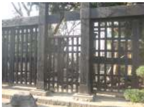
☆右が円通寺の黒門 ☆上が浄閑寺