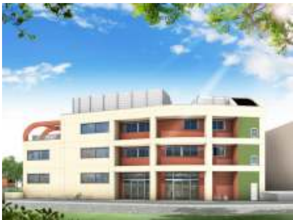
南千住保育園の完成予想図