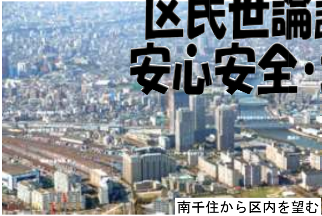
南千住から区内を望む