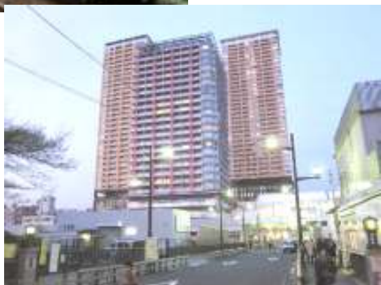
☆超高層ビルの建つ日暮里駅前(右) ☆京成スカイアクセス(左)