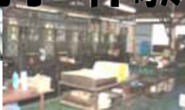
見学体験スポット 自転車 (上) エボナイト (右)