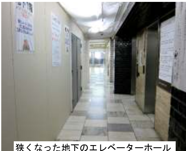
狭くなった地下のエレベーターホール