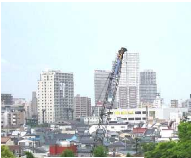
区役所から南千住を望む

新しく、近代的な街と施設、その一方で子どもを育てる手だてが不足している街：これはまともなまちづくりではありません。必要な保