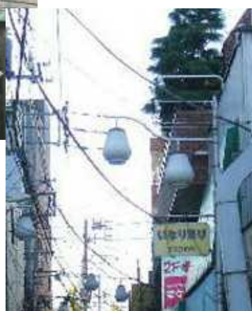
町屋地域の商店街装飾灯 この維持もなかなかきびしいようです