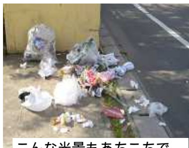
こんな光景もあちこちで

ゴミ集積所の食いつらされた生ゴミが散乱、頭上からカラスが急接近...などなど不快や危険を感じた方も多いはずで