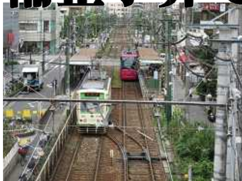
荒川区の一般会計2009年度決算