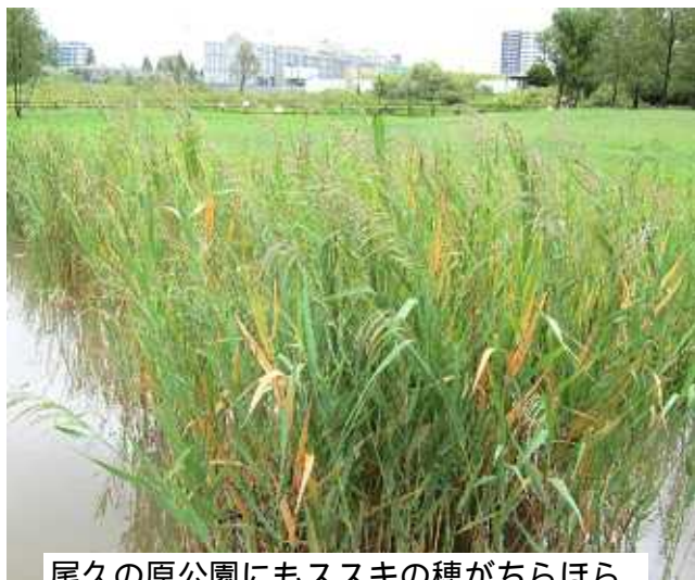
尾久の原公園にもススキの穂がちらほら

ところで今夏の異常な猛暑は、やはり地球温暖化と関係するのでしょうか。数十億年かかってつくられた地球の生命維持装置をたった2、300年で、それも人間に手によって破壊するとしたら、なんと愚かな行為だろうか。それも幾多の生命を巻き添えにして。