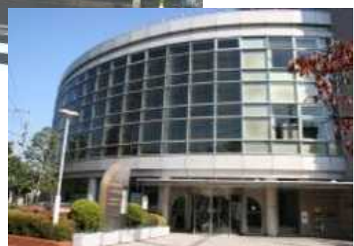
(右) 南千住図書館 (左) 町屋図書館

図書館は、よく利用されますが、荒川区の図書館で図書やCDを借りる時に必要な「利用登録」を調べてみました。それを各町丁目別に見ると、当然のことですが、図書館に近い地域の登録率が高くなっています。 町屋地域では、町屋図書館がある町屋5丁目31.8%で全区的にも高くなっています（左表参照）。ちなみに他地域を見るといずれも図書館所在地の次の丁目が高くなっています。 南千住6丁目33.8% 南千住図書館 荒川4丁目30.4% 荒川図書館 東日暮里3丁目34% 日暮里図書館 西尾久3丁目26.8% 尾久図書館 逆に町ごとでは、東尾久19.4% 西尾久17.5%と低くなっています。