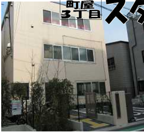
オープンしたスタートまちや