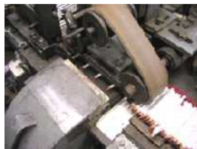
鉛筆の塗装行程の一部