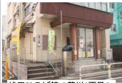
峡田ひろば館（荒川1丁目）

精神的なダメージも含め帰宅できない事態になっている方が、現在でも5家族15人ほどおられます。現在は、峡田ひろば館で避難生活をしています。お住まいの形態は、様々ですが、一刻も早く日常生活を取り戻せるよう支援が必要です。