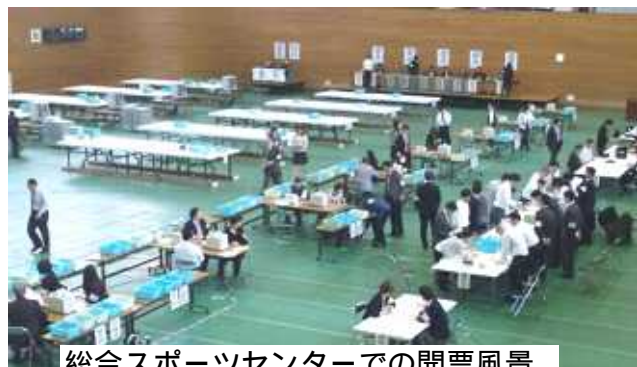
総合スポーツセンターでの開票風景

区議会議員選挙では、ご協力いただきありがとうございます。選挙中訴えた公約の実現にむけて、みなさんの願いやご期待にこたえるため力を尽くします。 東日本大震災への救援、復興支援とともに区民のいのちとくらし、安全をどう守っていくのか...問われています。新しい議会で見なさんと一緒に「福祉・防災のまちづくり」に力一杯取り組んでいきたいと思えます。よろしくお願いたします。