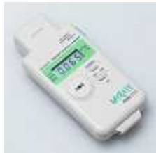
今回使用した測定器はALOKA PDR-101型 ポケットサーベイメーター(上)

果は、全体として草むらなの方が高いようです。いまだ範囲に放射能に汚染された稲わらを食った牛から高濃度のセシウムが検出され大問題になっています。なるべく放射線を浴びないようにすることが大事です。測定してこそ安心とともに必要な対策もたて