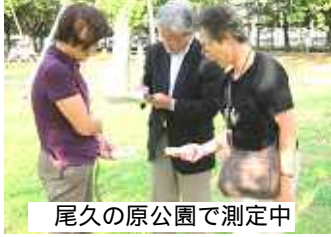
尾久の原公園で測定中

放射線量測定(尾久の原公園、瑞光橋公園) 単位はμSv/h(マイクロシーベルト/時間)