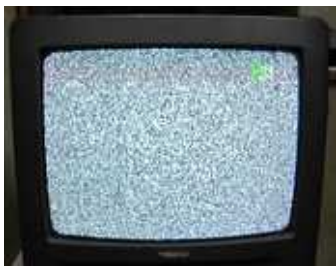
砂嵐の画面(上) 24日正午から「最後通告」

弁護士と横山区議が相談をお受けします。秘密は厳守します。お急ぎの場合は、北千住法律事務所の相談日などご紹介いたします。 生活相談は、随時受け付けています。 TEL&FAX 3895-0504 不在時は、留守電へ、後で連絡します。 区役所控室 3802-4627