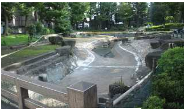
現在の区役所公園の釣り堀池の様子

ところで電力使用制限令が解除 されて、区内施設も通常に戻りま した。節電はこれからも必要です し、私たちの生活の仕方もある考 えるときに考えています。しかし、あの 「電力不足」「計画停電」騒ぎは