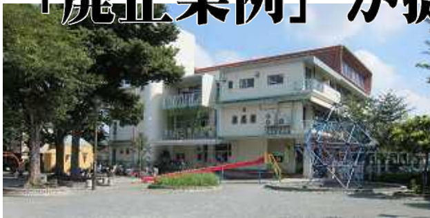
前面に区立藍染公園が広がる好立地…