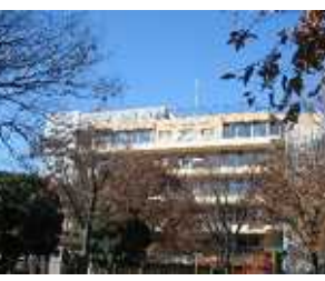
南千住6丁目に来年4月開設予定の特養ホーム「癒しの里」

生活圏毎の高齢者の分析があります。生活機能(閉じこもり、転倒、軽度認知など)は、各地域ともほとんど同じ比率で出現しています。同時に高齢者数、一人暮らし世帯などで地域ごとに大きな違いが生まれて