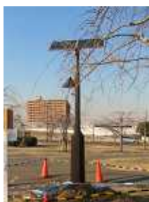
上が災害用街路灯、右はインターロッキング舗装工事...

いま尾久の原公園は大規模改修の真っただ中。どんな改修をしているのか、全体を見回してきましょう。電化通り側の入り口一帯は、インターロッキング舗装工事をしていました。また、公園内部では、「はらっぱ」のかなり部分を工事用の柵で囲ってコンボも使い土を掘り返しています。その他、防災用照明灯(ソーラーシステム)も設置さ