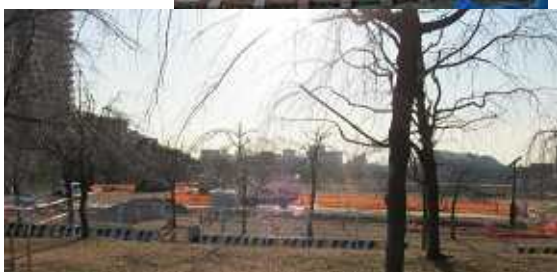
「はらっぱ」での工事風景