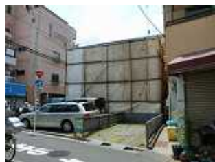
解体を待つ老朽家屋の囲い 火災現場…

奇しくも尾久消防団の操法大会が尾久の原公園で開催されていた5月27日、電化通りの空き家(私の事務所の近所)で火災が発生。小火で済んで何よりでしたが、尾久消防署はもとより操法大会に参加中の消防団員のみなさんも駆けつけました。しかし、本来火の気のない空き家からの出火ですから、原因が心配です。放火やたばこのポイ捨てではないかという心配もあります。そう考えると区内で見