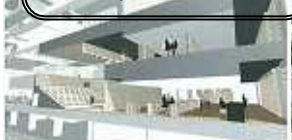
複合施設の館内完成予想図 下は、町屋と尾久の両図書館

規模・内容、施策の優先順位の見直しと地域図書館のリニューアル計画を 区議会に建設予定の図書館・吉村昭文学館・子ども施設の「複合施設」基本設計に関する報告がありました。規模は、敷地3千8百㎡・地上5階・地下1階建て、床面積1万㎡(うち図書館5千百㎡)。土地購入15億円、1㎡40万円としての40億円で計55億円・これまでの区施設建設にない規模です。2016年度の竣工・開設の予定だとしています。しかし大地震から住民の命と財産を守るなど防災 福祉のまちづくりや不足する保育園、幼稚園など優先課題が山積。施策の優先順位の見直しも必要です。複合施設も図書館中心に見直し、子ども施設は、旧町屋ひろば館など使って地域毎の児童館機能強化で対応することも検討すべきです。