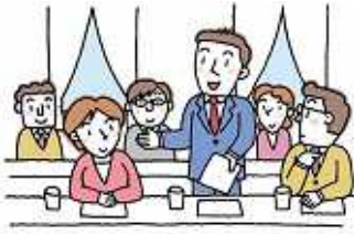
荒川区議会 常任委員会と議会運営委員会