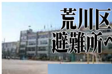
今回の訓練会場になった五峡小と原中

こうした発災後の応急対策は、重要で、同時に、応急対策は、施設と人によって機能が発揮されますが、壊滅的災害ではそこが機能不全におちいることを大震災は示しました。やはり避難しなくてもよい、災害を未然の防止する対策を最重要課題にした防災計画の策定と実施が必要です。