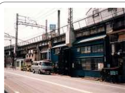
かつての高架下...今では夏草が

枝野経産相は、首相官邸前抗議行動を呼びかける首都圏反原発連合代表と野田首相の面会に反対を表明。枝野氏自身「経済界などに直接の形で意見を伺うことはしない、パブリックコメントでお願い」などといいました。しかし政府の財界のご意見伺いや懇談は日常的。消費税も原発再稼働も財界・経団連の要求丸呑みです。阿吽の呼吸か?