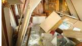
中越地震で家具が転倒した室内 L字金具で固定した家具