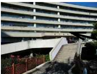
矢印の部分に設置。右は設置場所の図