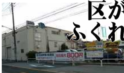
上の建物が今回購入する 用地にある印刷...