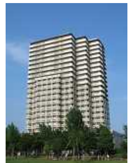
町屋5丁目区民住宅

しかし66室が空きになっています。57㎡~ 89㎡と広めの住宅だが、家賃が月14万円以上、 共益費も1万円かかります。今年、4月から値下 げしましたが、子どもが3人以上いる世帯に対 し、月2万円の減額を行ったが、民間賃貸住宅 とさほど変わりません。住宅ローンの支払いよ り高い人もいます。建 設から15年位経過し、 入居世帯の収入も世帯 構成も変化し転居する 方もいるだろう。せっ かくの区立区民住宅、 空いているのではもっ たいない!!