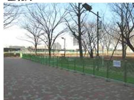
封鎖され寂しい尾久の原公園の正月

今年の正月は、少しまちなみが変わってしまいました。ダイオキシン騒ぎによる尾久の原公園の使用停止です。