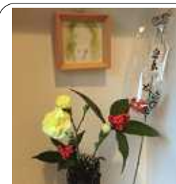
わが家のささやかな正月飾り