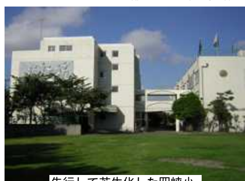
先行して芝生化した四峡小

「校庭芝生化東京宣言」が出たようです... 四峡小は全面芝生化していますが、どうでしょうか 2001年初めて芝生化した杉並区立和泉小学校で、2月7日に東京都の公立校芝生化推進大会が開催されました。荒川区教育委員会は、これまでに区内9校で校庭芝生化を行っており、「芝生化宣言」に賛同し、この大会に参加。しかし参加自治体は杉並・新宿・練馬・葛飾区・昭島市・清瀬市・武蔵村山市・瑞穂町・新島村・神津島村の11市区町村だけ。芝生は「転んでも痛くない」「砂ぼこりが無い水はけが良い」「都市のヒートアイランド対策」など良い点もあります。しかし、芝生化した四峡小を見て年間3~4カ月間の養生期間があり、子どもたちが校庭を使えないデメリットもあり、一部実施など工 まちの話あれこれ 夫しているところも。現在の全天候型などで良いという意見もあります。教育委員会は、実施した学校のメリットとデメリットをよく検討し、宣言に基づき、学校や地域の声もよく聞いて進める必要があります。 横山幸次