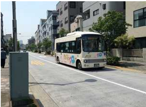
防災尾久の原公園通り(通称疎開道路)を走る町屋さくら...

「町屋さくら」の運行がはじまって半年を過ぎました。当初「空気を運んでいる」などと言っ方もいました。いまはどうなっているのか。私の実感でも徐々に利用者は、増えているようです。確かに最初の頃は、東尾久六丁目ライフ前は止め停留所を乗車ゼロのまま通過することがほとんどでしたが、いまでは降り降りしたり、乗車待ちの方を多く見かけます。ご高齢の方などに都電、都バス、日暮里舎人ライナーなどと組み合わせさせた便利な利用方法を知らせていくことも大事な気がします。最近では、サライーマンの方なども駅に向かうのでしょうか、町屋6丁目のバス停で待っている光景も見かけるようになりました。いずれにしても、