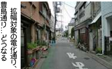
拡幅対象の電化通り、豊島通り…びっぴなる

住民合意を基本に誰もが住み続けられる倒れない、燃えないまちづくりを求めます 東京都の不燃化10年プロジェクトがスタート。今回は、荒川247丁目に続き、町屋・尾久地域も申請。認定されれば、荒川区のほぼ全域に同制度の網がかかることになりま(下図参照)。 この事業は、不燃化領域率(街の燃えにくさの指標)を2020年度までに70%にするため、道路拡幅・危険家屋の除去・不燃化への建替えなどをすすめるものです。不燃化領域率だけをとると、道路、公園の整備、マンションなどの建設が進めば率が上がる計算です。ややもすると道路拡