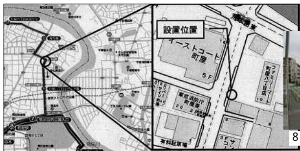
8丁目ファミリーマート