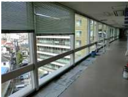
通路枝の窓側に雨漏り、水漏れした天井は、修理の途中です。

課題は、多くあり、試行錯誤のようです。機器のトラブルから使い方をみて十分な検証と研究(左欄参照)が必要です。教育に拙速や押しつけは禁物です。子どもの立場に立った真摯な検討を求めたいと思います。