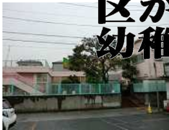
区立町屋保育園 (上) 町屋1丁目用地 (右)