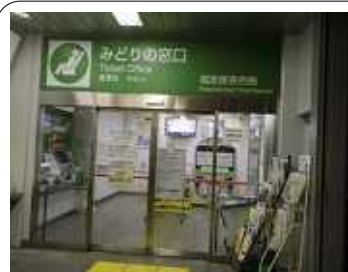
11月16日で廃止されたJR田端駅の「みどりの窓口」

弁護士と横山区議が相談をお受けします。秘密は厳守します。お急ぎの場合は、北千住法律事務所の相談日などご紹介いたします。 生活相談は、随時受け付けています。 TEL&FAX 3895-0504 不在時は、留守電へ、後で連絡します。 区役所控室 3802-4627