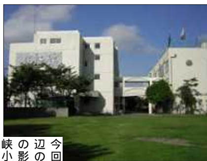
今回七峡小(下)が抽選に。周辺のマンションや建売住宅建設の影響もあるのでしょうか。四峡小(上)も抽選です。