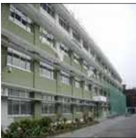
2014年度希望校受付後の町屋地域の状況 小学校