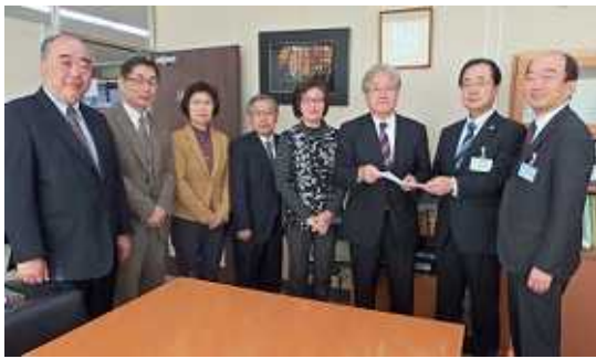
佐藤・北川両副区長に要望書を手渡す

子ども貧困やアベノミクスの暮らし破壊から暮らし・命・営業を守る防波堤の役割を求め、1月14日、日本共産党区議団は、これまでの区内団体・個人のみなさんからの聞き取り、相談で寄せられたご意見、ご要望、そうした声に基づく議会質問など改めてまとめた316項目の予算要望を区に提出しました。