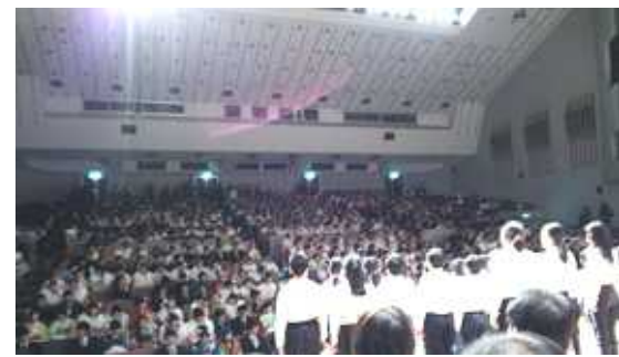
2015年荒川区の成人式の様子

「まちの話題あれこれ」 戦後70年、阪神淡路大震災20年、東日本大震災4年成人式と成人になった若者について考えました。今年の新成人は、全国126万人、荒川区では1879人で昨年のより若干増加したようです。いずれにしてもこれから担う世代であり、大いに期待したいものです。同時に、若者を巡る時代の流れは決して良いとはいえません。ブラック企業に代表される若者使い捨て、非正規・低賃金労働の横行、「戦争する国づくり」...など。いまこうした流れに抗って、声を上げ行動する若者が増えていることは希望です。合わせて感慨深いのは、今年成人を迎えた青年は、戦後70年の節目、そして阪神淡路大震災の年に生まれ、東日本大震災から4年たった中で新たな一歩を踏み出す事になります。大変な災禍に直面し、それを乗り越えて行くためには、悲しみを噛みしめながら未来へ能動的に働きかける、知恵と勇気が必要でしょう。その