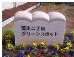
かつてのパン屋さんの跡地...

弁護士と横山区議が相談をお受けします。秘密は厳守します。お急ぎの場合は、北千住法律事務所の相談日などご紹介いたします。 生活相談は、随時受け付けています。 TEL&FAX 3895-0504 不在時は、留守電へ、後で連絡します。 区役所控室 3802-4627