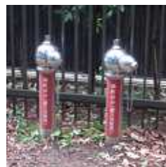
給水栓 発電機など 電気設備を設置

工事中の「騒音」は、かなりのものです。住宅密集地での工事の場合大変そうですが、やはり危険度の高い木造密集地域での設置が期待されます。