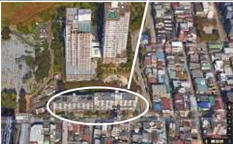
また一つまちの姿が変わりますね...

町屋5丁目旭電化通り沿いの都営住宅は、建て替えのためすでに全世帯が移転しています。町屋だけでなく西尾久などの都営住宅にも移っています。築50年近い住宅で老朽化も進みエレベーターもなくなりますが、新たな地域の課題になってきます。 横山幸次