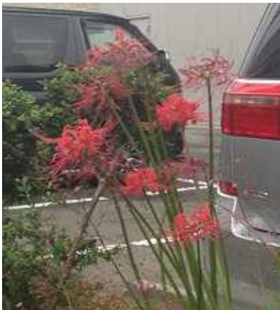
区役所の駐車場の側でひっそり