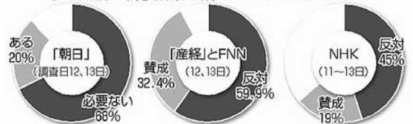
今の国会で戦争法案を成立させることについて

申込み資格 区内在住・5年以上 単身用 15人(65才以上) 二人世帯用 5世帯(65才以上と60才以上の配偶者等が兄弟姉妹) 申込期間 9月24日(木)25日(金)午前9時~午後5時 申込場所 区役所3階304会議室 登録期間 27年11月6日~28年11月5日 問合せ 福祉推進課3802-3111内線2615