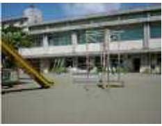
地域別の認可保育園入所申し込み状況